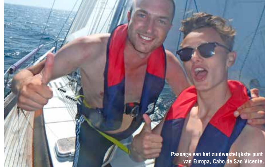
Passage van het zuidwestelijkste punt van Europa, Cabo de Sao Vicente.