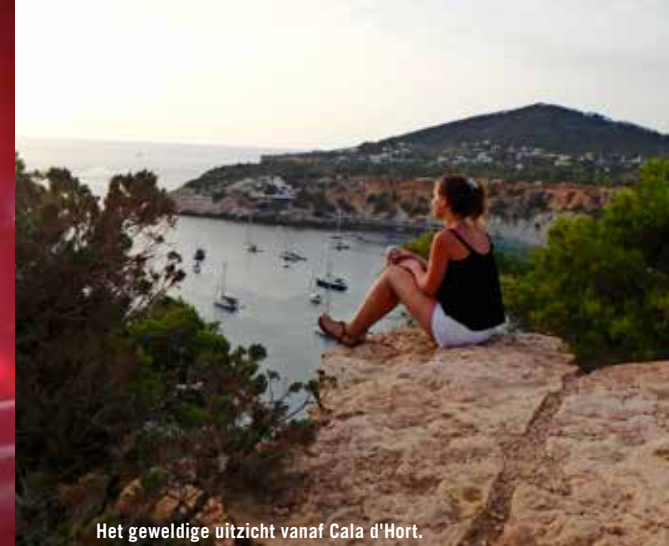
Het geweldige uitzicht vanaf Cala d'Hort.