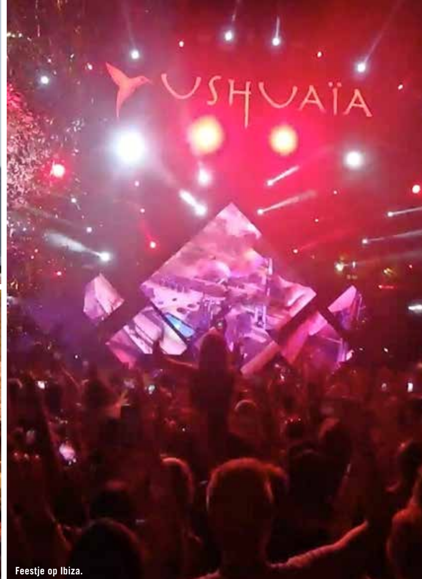
Feestje op Ibiza.