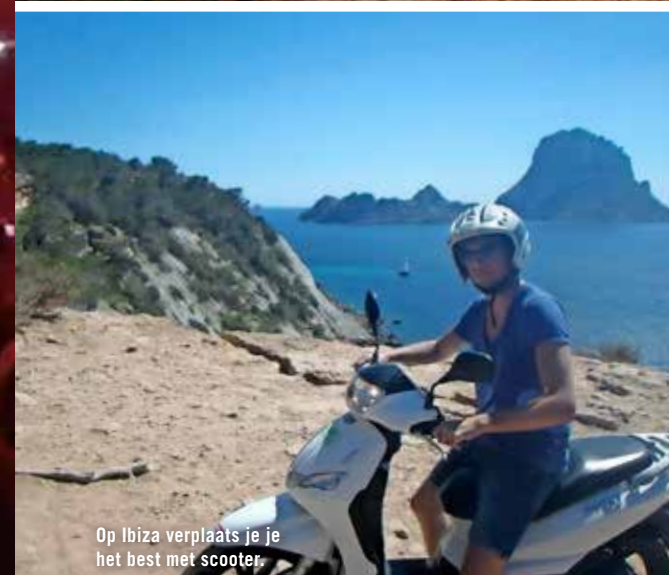
Op Ibiza verplaats je je het best met scooter.

Gevoelsmatig staat er windkracht 7 en er bekruipt ons een onbehaaglijk gevoel. "We gaan terug naar de boot!"