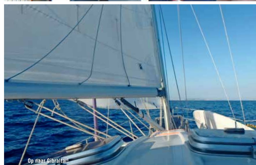
Op naar Gibraltar!