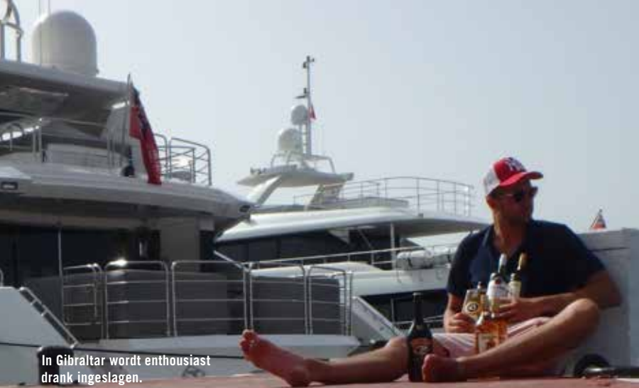
In Gibraltar wordt enthousiast drank ingeslagen.