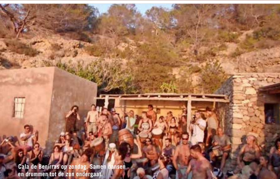
Cala de Benirras op zondag. Samen dansen en drummen tot de zon ondergaat.